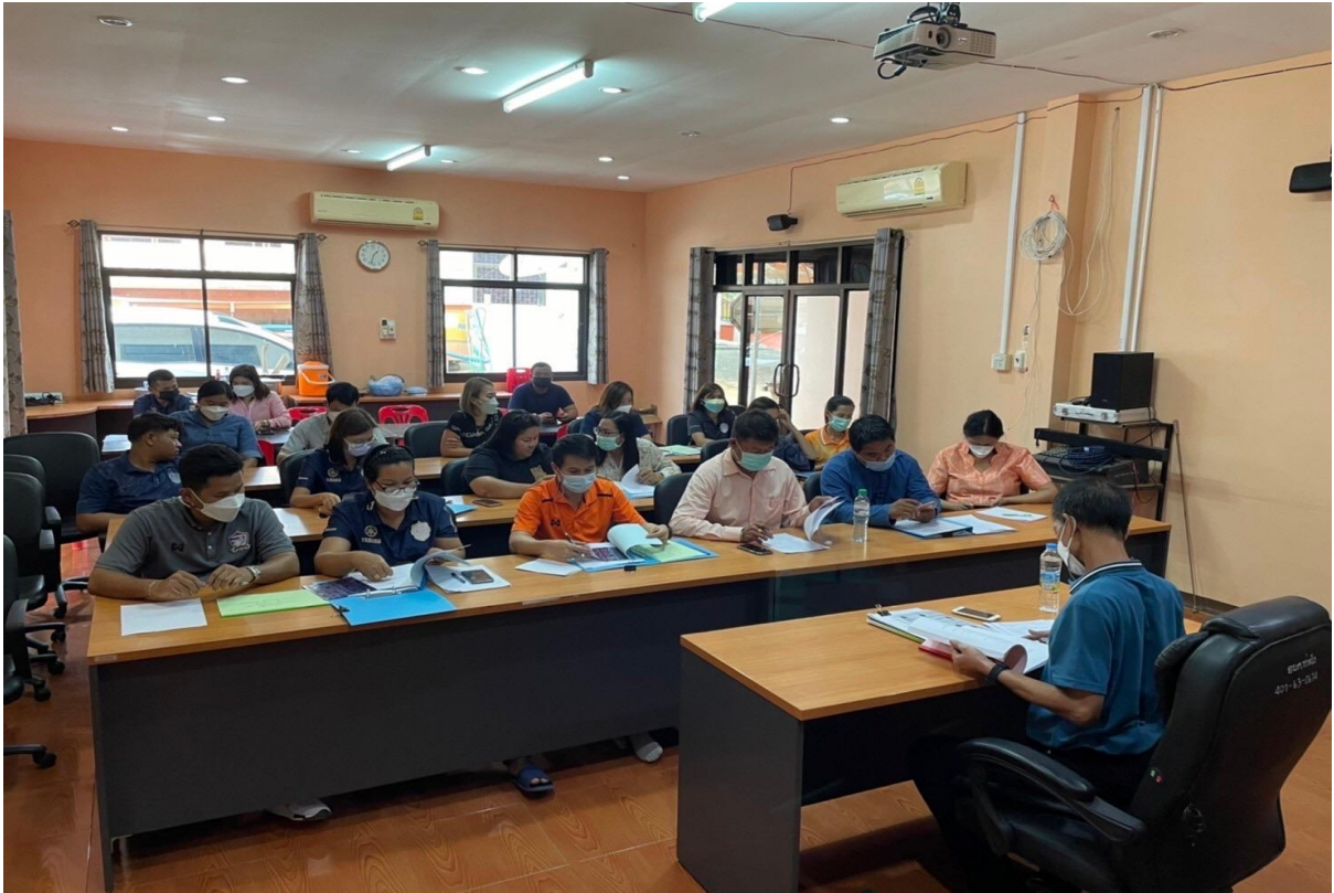
รูปถ่ายการประชุมฯ เมื่อวันที่ ๒๖ มีนาคม ๒๕๖๙ เวลา ๑๐.๐๐ น. ณ ห้องประชุมสภาองค์การบริหารส่วนตำบลท่าด้วง อำเภอหนองไผ่ จังหวัดเพชรบูรณ์